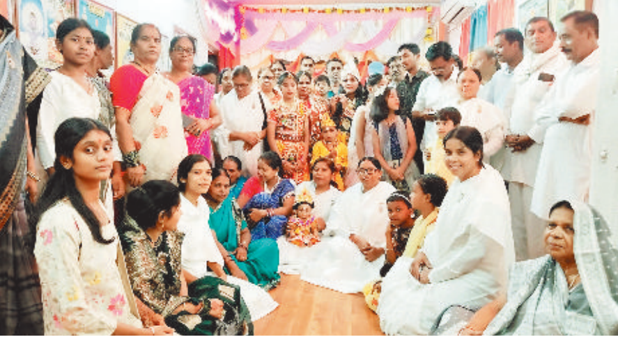
श्रीकृष्ण जन्माष्टमी पर सांस्कृतिक कार्यक्रमों का आयोजन

मनेन्द्रगढ़। युनिवर्सल पब्लिक स्कूल में श्रीकृष्ण जन्माष्टमी का पर्व बड़े ही हर्षोल्लास एवं धार्मिक उत्साह के साथ मनाया गया। यह दिन विद्यालय के लिए विशेष रहा, क्योंकि इस अवसर पर विविध प्रकार के सांस्कृतिक कार्यक्रमों और प्रतियोगिताओं का मय आयोजन किया गया। इस वर्ष जन्माष्टमी उत्सव को और अधिक रोचक एवं प्रतिस्पर्धात्मक बनाने के लिए विद्यालय में इंटर हाउस प्रतियोगिता आयोजित की गई। इस प्रतियोगिता में चारों हाउसने शिवाजी हाउस, टैगोर हाउस, अशोक हाउस और रमन हाउस के विद्यार्थियों ने अत्यंत उत्साहपूर्वक भाग लेकर अपनी कला, प्रतिभा और कोशल का शानदार प्रदर्शन किया। कार्यक्रम की शुरूआत मनमोहक फैसी ड्रैस प्रतियोगिता से हुई। इसमें छोटे-छोटे बच्चों ने श्रीकृष्ण, राधा, बलराम, मोरा आदि विभिन्न किरदारों का रूप धारण कर अपनी परतुओं से सबका दिल जीता लिया। इसके पश्चात विद्यार्थियों ने मनमाना सोनो डंस और रजनीकान्त ग्लोब डंस प्रस्तुत किए। इनमें श्रीकृष्ण लीला के विभिन्न प्रसंगों का सुंदर चित्रण किया गया। सांस्कृतिक प्रस्तुतियों की श्रृंखला में विद्यार्थियों द्वारा प्रस्तुत नाटक में दर्शकों को भाव-विभोर कर