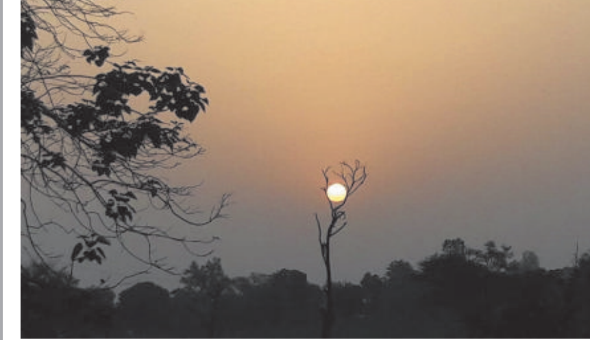
बैकुण्ठपुर। आज विश्व फोटोग्राफी दिवस है, यह फोटो कुछ वर्ष पूर्व पटना क्षेत्र में एनएच 43 किनारे स्थित सूखे पेड़ के टहनियों के बीच सुबह के समय सूर्य ऐसी स्थिति में पहुंचा, तब परफेक्ट शॉट लिया गया, जिसे देखकर लगता है कि सूर्य को प्रकृति का सहारा मिल गया।