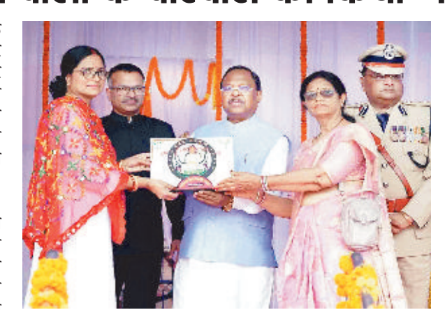
यह सम्मान उनके महान निर्णय और समाज में देहदान व अंगदान बचाने का कार्य कर रही है। इस दौरान रेंड क्रॉस सोसायटी ने ने लोगों से आह्वान किया है कि हम सब मिलकर इस महान परंपरा को आगे बढ़ाएं। रक्तदान, अंगदान और देहदान जैसे संकल्प केवल

अम्बिकापुर। स्वतंत्रता दिवस के अवसर पर सरगुजा जिला ने पूरे प्रदेश के लिए एक नई और प्रेरणादायी मिसाल पेश की है। इस राष्ट्रीय पर्व पर देहदान करने वाले परिवारों को सम्मानित करने वाला सरगुजा प्रदेश का पहला जिला बन गया है।