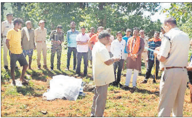
घटना स्थल पर लोगों की भीड़ व जांच करती पुलिस।